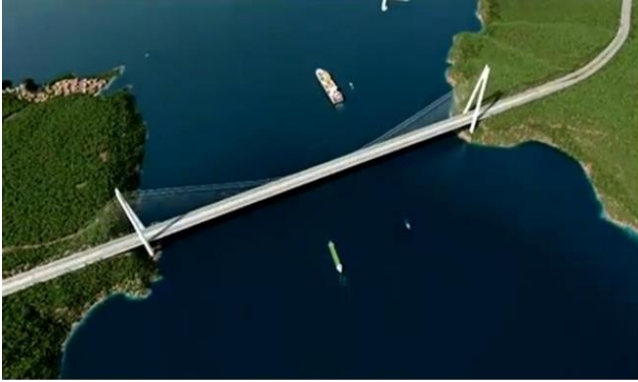
İstanbul 3. Köprü Projesi