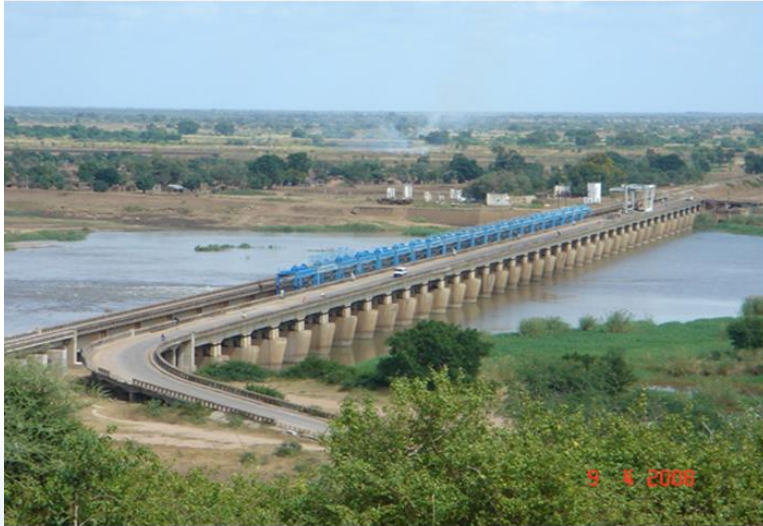
Mozambik Macarretane Rehabilitasyon Projesi