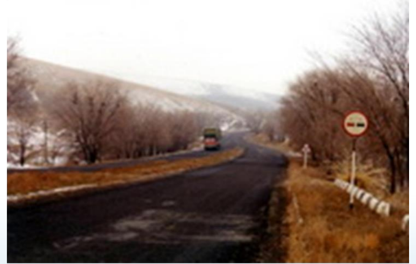
Almati – Bişkek Yolu Rehabilitasyon Projesi