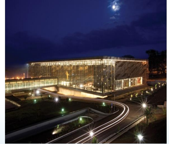
Ekvator Ginesi Sipopo Kongre Merkezi (ENR 2013 En İyi Küresel Proje Ödülü)