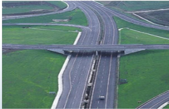
İstanbul - İzmir Otoyolu Gebze Bağlantısı