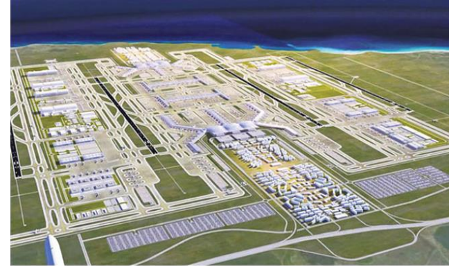
İstanbul Yeni Havalimanı Projesi