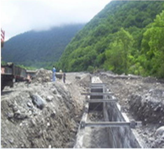
Azerbaycan Sel Önleme Projesi Mühendislik Danışmanlık Hizmetleri