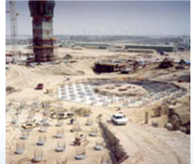
Almati – Bişkek Yolu Rehabilitasyon Projesi