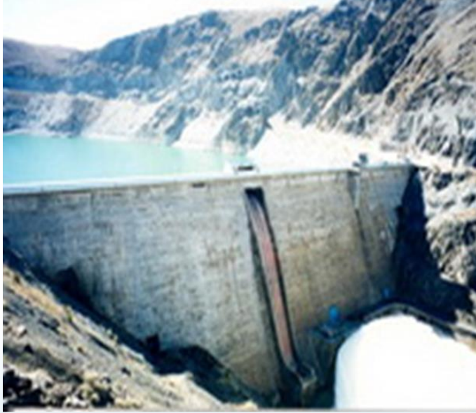
Kırgızistan Sulama Sistemi Rehabilitasyonu Projesi 3. Faz Danışmanlık Hizmetleri