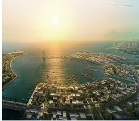
Katar Lusail Şehri Tasarım Hizmetleri Projesi